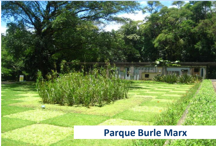
Parque Burle Marx