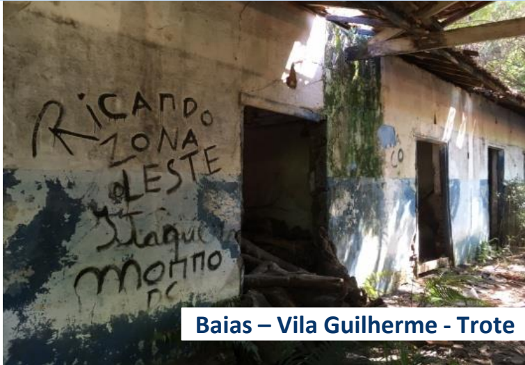
Baias – Vila Guilherme - Trote