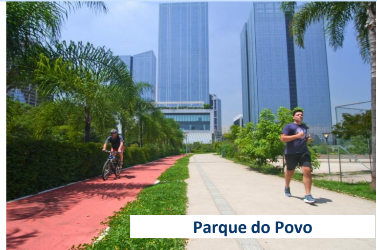
Parque do Povo