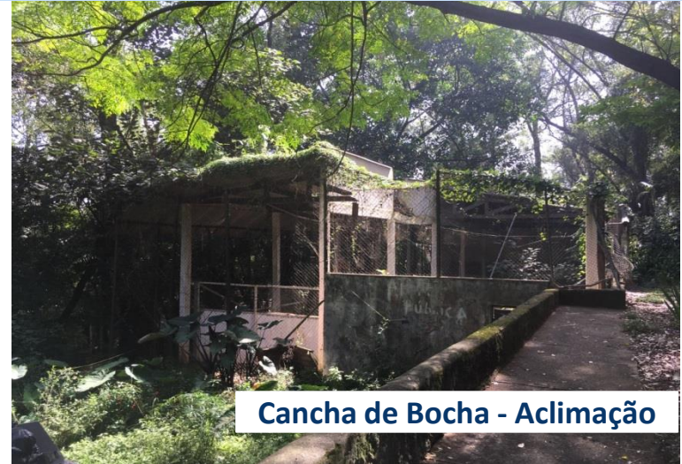
Cancha de Bocha - Aclimação